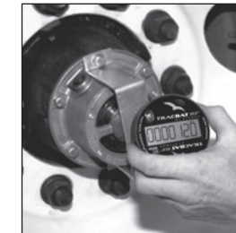
Installez le TracBAT PRO avant que la minuterie atteigne le zéro pour prévenir un comptage dû à la manutention.