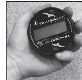
Actionner le TracBAT PRO en brassant vigoureusement pour 4 secondes.