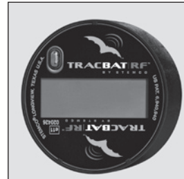
Display turns off when vibration is detected (vehicle moving) to conserve energy.