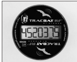
TRIP mode shows mileage with tenths and TRIP icon.