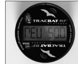
Le mode REV montre si l'unité a été programmée RPM ou RPK.