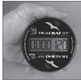
Display will turn on and timer will begin to count down.