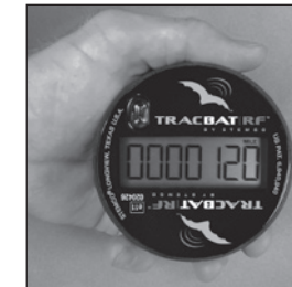
L'affichage s'allumera et une minuterie commencera le décompte.