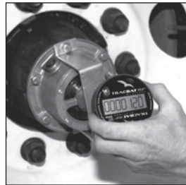
Install TracBAT PRO before timer reaches zero to prevent counts induced by handling.