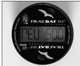
Modalidad REV muestra RPM o RPK para la cual la unidad ha sido programada.