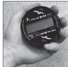
Despierte la unidad TracBAT PRO sacudiéndola vigorosamente durante 4 segundos.