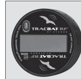
A fin de ahorrar energía, la pantalla se apaga cuando se detecta vibración (vehículo en movimiento).