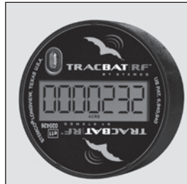
Display turns on when the vehicle is at rest.

The display of the TracBat Pro is designed to conserve power by not displaying readings while the vehicle is in motion. It should be noted that the display will orient the reading to the upright position regardless of where the display is located when the vehicle stops.