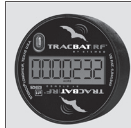
La pantalla se enciende cuando el vehículo está estacionado.

La pantalla del TracBAT PRO esta diseñada para conservar energía al no desplegar las lecturas cuando el vehiculo esta en movimiento. Note que la pantalla desplegara los números en la posición adecuada sin importar en donde se localice cuando la unidad se detenga.