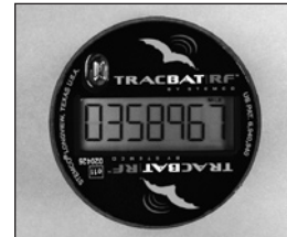
Le mode LIFE affiche le kilomètre sans dixièmes.

L'unité TracBAT PRO vient équipé de deux ou trois mode d'affichage tout dépendant si le mode TRIP à été activé: LIFE, TRIP (optionel), et REV par mile ou kilomètre. Pour basculer l'affichage entre les modes LIFE, TRIP et REV, utiliser la paume de la main pour recouvrir la bulle ronde sur la face de l'unité pour au moins 1 seconde et ensuite la retirer. Si l'unité est en plein soleil, la surface entière doit être recouverte avec la paume de la main pour bloquer plus de lumière d'atteindre le capteur. Sur les unités avec le mode TRIP, la distance du voyage est affichée avec les dixièmes de révolutions et est reconnu par l'icône TRIP. Pour remettre à zéro l'affichage TRIP, basculer entre les modes LIFE, TRIP et REV 5 fois, rapidement. Note: l'unité ne peut pas basculer plus rapidement qu'à toutes les 1.5 secondes. La bulle peut aussi est recouverte et découverte pour visionner la calibration des révolutions par mile ou kilomètre. Simplement répéter le processus utilisé pour afficher le voyage jusqu'à ce que l'affichage indique (REV XXX). The XXX représente le nombre de révolutions par mile ou kilomètre pour lequel l'unité a été programmé. Sur les unités sans TRIP, il n'y a que 2 modes d'affichages. Tous les autres en ont trois (LIFE, TRIP, et REV). Le TracBAT va retourner à l'affichage du kilomètre après 10 secondes.