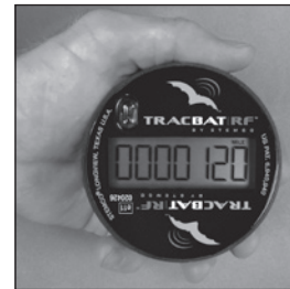
La pantalla se encenderá y el temporizador comenzará un conteo regresivo.