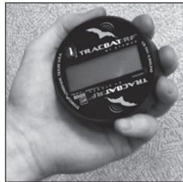
Wake TracBAT PRO by shaking vigorously for 4 seconds.