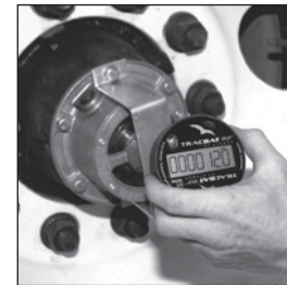
Instale la unidad TracBAT PRO antes de que el temporizador llegue a cero para evitar conteos inducidos por la manipulación.