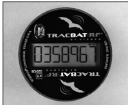
La modalidad LIFE muestra el kilometraje sin decimales.

El TracBAT PRO esta equipado con 3 modos de pantalla dependiendo si la función de VIAJE ha sido programada. VIDA, VIAJE (si de programa), y REV. Para cambiar de una pantalla a otra use la palma de su mano y cubra la burbuja en la cara de la unidad por 1 segundo, y después descúbrala. Si la unidad esta bajo la luz solar, la unidad debe de ser totalmente cubierta con su mano para evitar que la luz llegue al sensor. La función de VIAJE será desplegada con resolución tenue y es indicada con el icono de VIAJE (solo si la unidad fue programada con esa función). Para resetear la función de VIAJE, cambie los modos de VIDA, VIAJE y REV en 5 ocasiones rápidamente. Nota: La unidad no debe ser cambiada entre una función y otra más rápido que 1.5 segundos. Para ver las revoluciones simplemente repita el proceso que es utilizado para ver la función de viaje hasta que la unidad muestre (REV XXX). Las XXX es el número de revoluciones por milla o kilómetro para el cual la unidad ha sido programada. En unidades sin la función de VIAJE, solo hay dos modalidades de pantalla. Todos los demás tienen tres modalidades de pantalla (VIDA, VIAJE, y REV). El kilometraje aparecerá en el TracBAT después de 10 segundos.