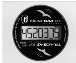
La modalidad TRIP muestra el kilometraje con decimales y el icono TRIP.