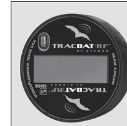
L'affichage s'éteint quand des vibrations sont détectées (véhicule en mouvement) pour conserver l'énergie.