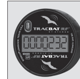
L'affichage s'allume quand le véhicule est au repos.

L'affichage va s'allumer lorsque le véhicule est au repos. Les chiffres et l'icône des unités va automatiquement s'aligner pour être lus du bon côté. La lecture du kilométrage se fait toujours dans la même direction que l'icône des unités.