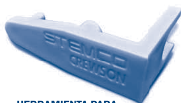
HERRAMIENTA PARA LA VARILLA DE EMPUJE/ OUTIL DE TIGE DE POUSÉE 195-1001

Muchas gracias por su apoyo continuo a la línea de productos STEMCO. / Merci pour votre appui continu des produits STEMCO.