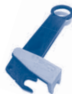
INSTALACIÓN DE LA VARILLA DE EMPUJE/ INSTALLATION DE L'OUTIL DE TIGE DE POUSÉE