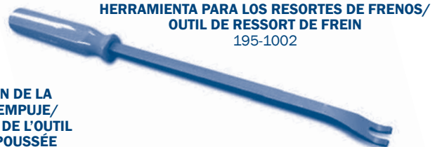
HERRAMIENTA PARA LOS RESORTES DE FRENOS/ OUTIL DE RESSORT DE FREIN 195-1002